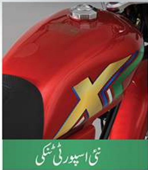
نئی اسپورٹی ٹینگی

راوی گروپ ایک دفعہ پھر پیش کرتے ہیں کچھ نیا۔ راوی پریمیئم 100cc Rx، نہایت مضبوط اور دلکش سواری۔ اعلیٰ معیار کا پاور انجن اور راوی گروپ کا اپنا تیار کردہ وزنی شیت میٹل فریم جس میں بے اضافی پکڑ اور اضافی مضبوطی، کچے کچے راستوں کے لیے۔ یہی نہیں راوی کی آفر سٹیس سروں اور ورنٹی پالیسی دے آپ کو ذہنی سکون اور اطمینان۔ آپ کے پیسے کی پوری وصولی صرف راوی موٹرسائیکلز۔