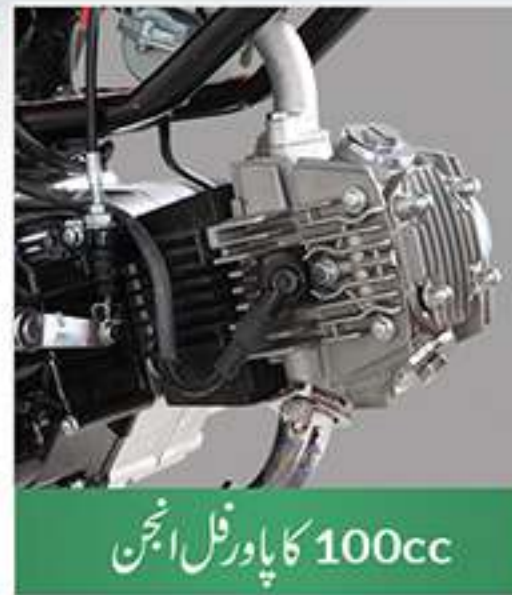
100cc کا پاور فل انجن