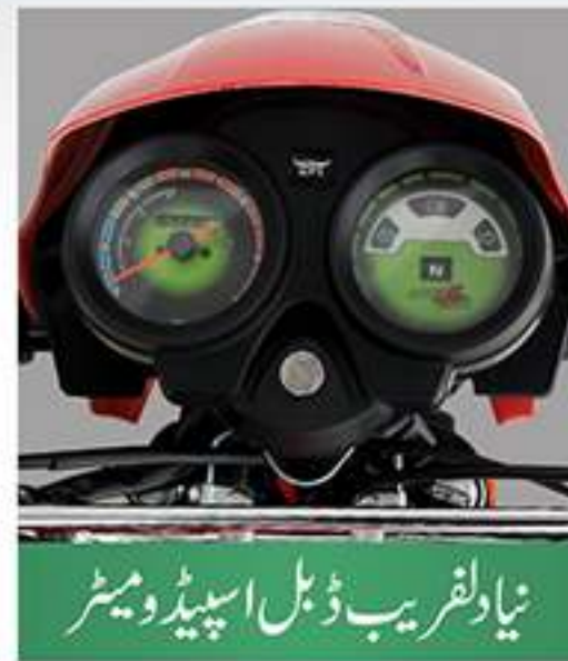
نیا دلقریب ڈبل اسپید و میٹر