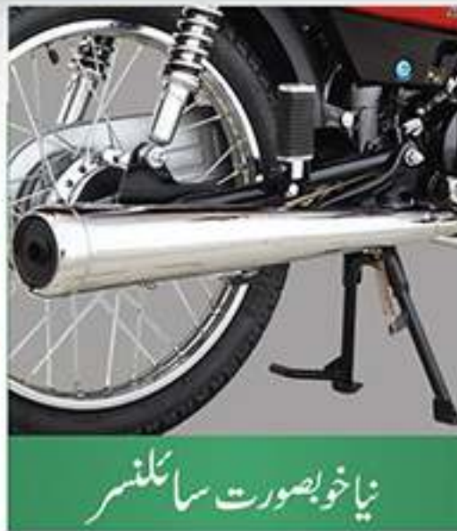
نیا خوبصورت سائلنسر